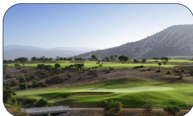
Golf de Tazegzout

Parcours Jaune Oued : 3068 mètres - Par 36